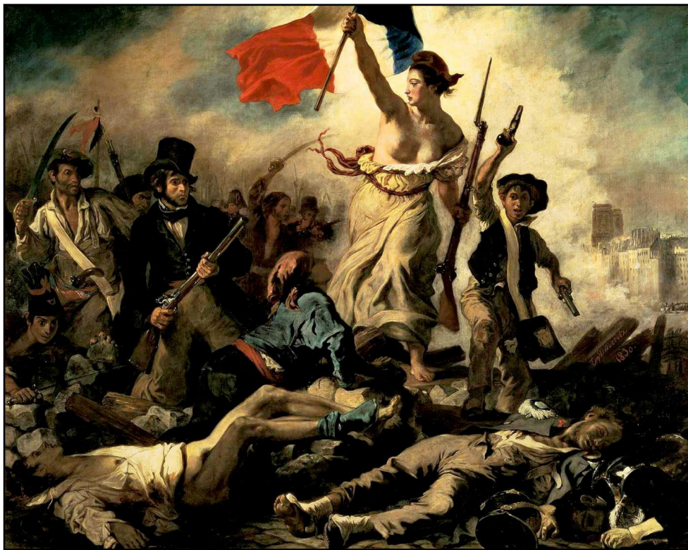
La liberté guidant le peuple, Eugène Delacroix, 1830 (Musée du Louvre, Paris).